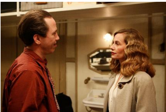
Abbildung 12 Django