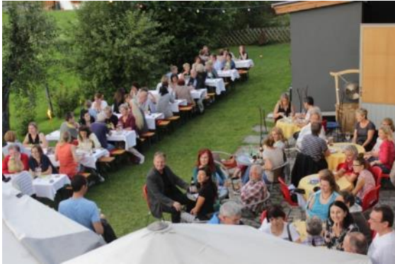
Abbildung 37 Rahmenprogramm