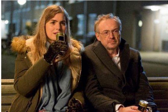
Abbildung 1 Arthur & Claire