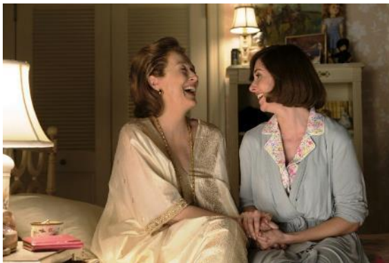
Abbildung 3 Die Verlegerin