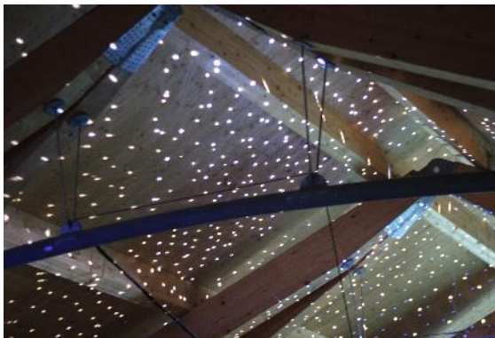
Abbildung 59 Rahmenprogramm