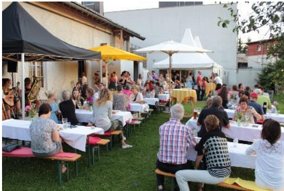
Abbildung 48 Rahmenprogramm