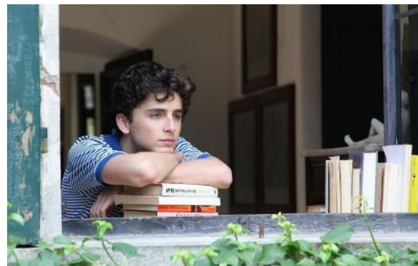
Abbildung 8 Call me by your Name