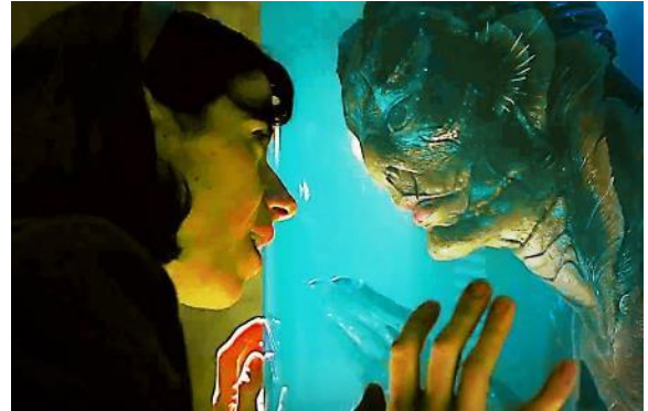
Abbildung 5 Shape of Water