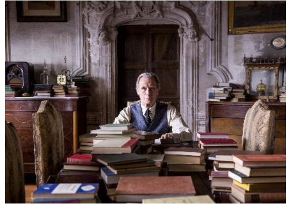
Abbildung 14 Der Buchladen d.F. Green