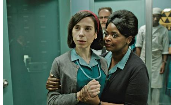
Abbildung 6 Shape of Water