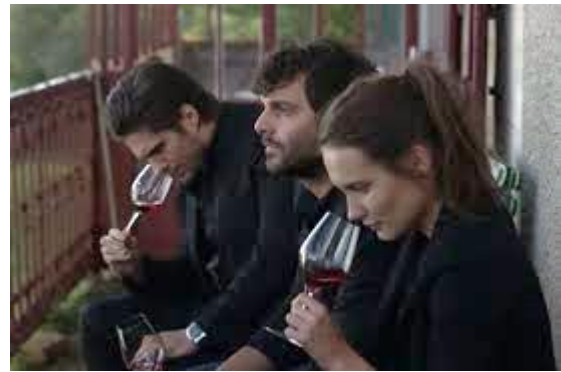
Abbildung 22 Der Wein u.d.Wind/Angerer Alm