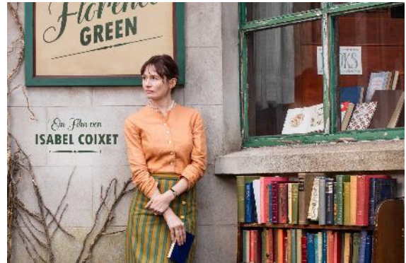
Abbildung 13 Der Buchladen d.F. Green