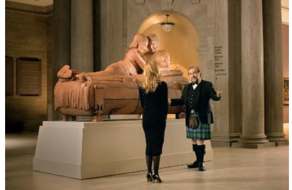
Abbildung 15 Das etruskische Lächeln (c) Constantin