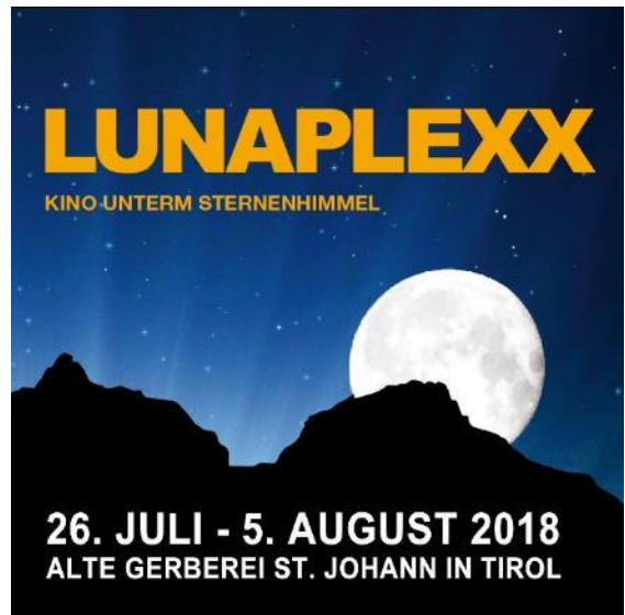
Abbildung 23 Logo Lunaplexx 2018