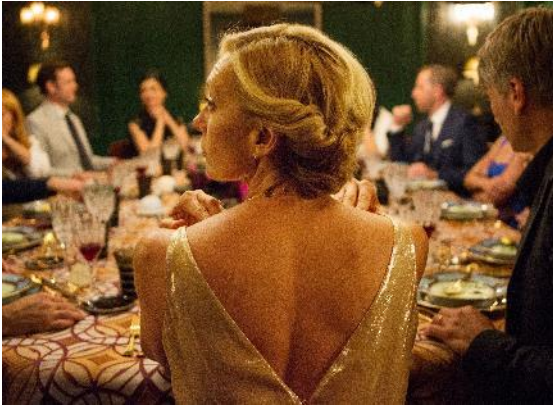
Abbildung 10 Madame (c) Constantin