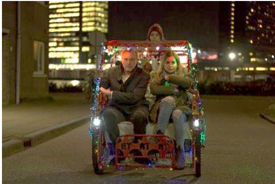
Abbildung 2 Arthur & Claire