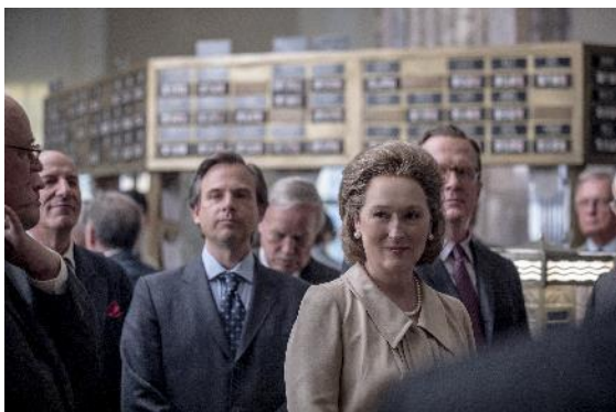
Abbildung 4 Die Verlegerin