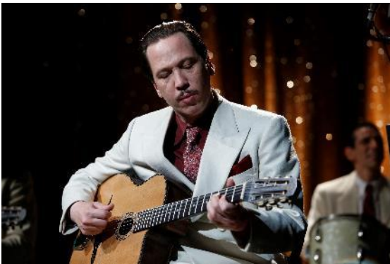
Abbildung 11 Django