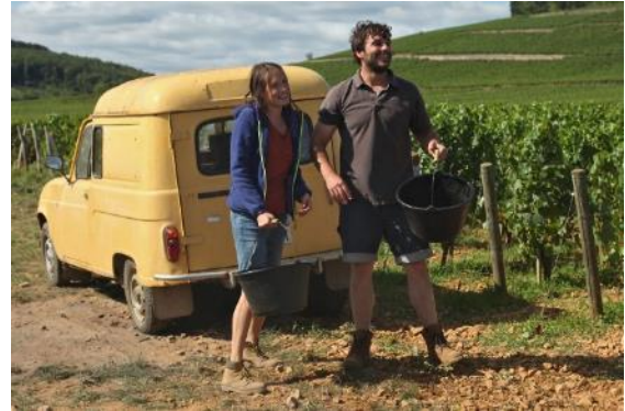
Abbildung 26 Der Wein u.d.Wind/Angerer Alm