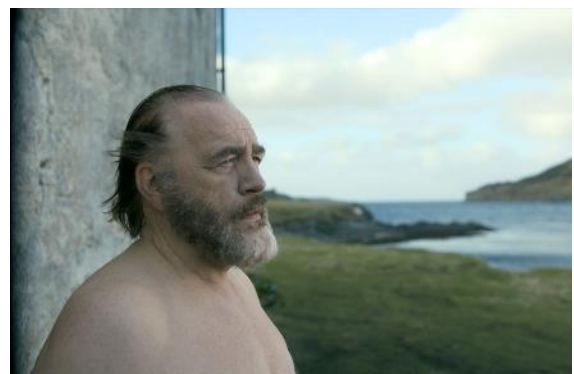
Abbildung 26 Das etruskische Lächeln (c) Constantin