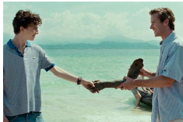
Abbildung 7 Call me by your Name