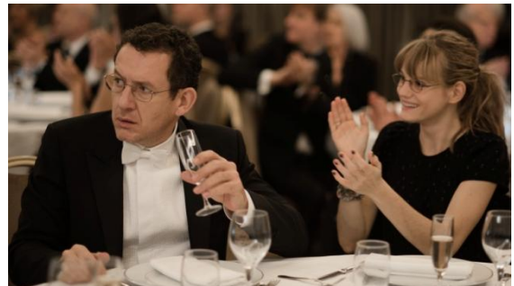
Abbildung 13 Nichts zu verschenken