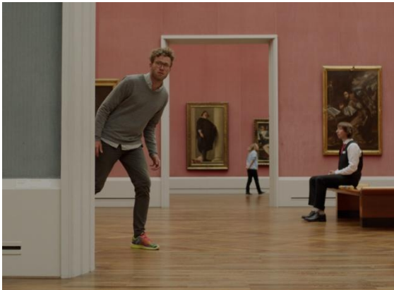
Abbildung 15 Selbstkritik eines bürgerlichen Hundes