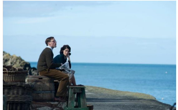
Abbildung 12 Their Finest