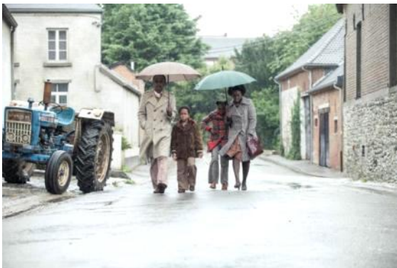
Abbildung 2 Ein Dorf sieht schwarz