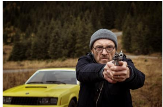
Abbildung 5 Wilde Maus