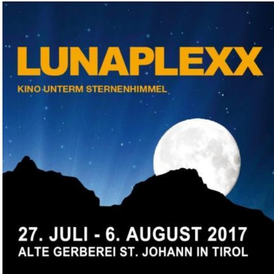
Abbildung 1 Logo mit Datum