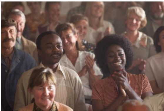
Abbildung 3 Ein Dorf sieht schwarz