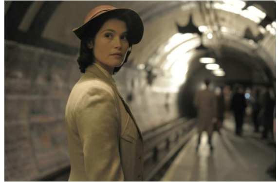
Abbildung 11 Their Finest