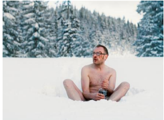
Abbildung 4 Wilde Maus