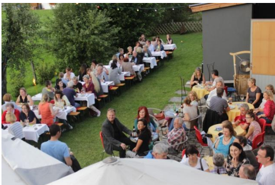
Abbildung 17 Im Garten der Alten Gerberei