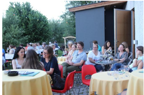
Abbildung 18 Im Garten der Alten Gerberei