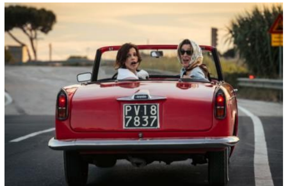
Abbildung 6 Die Überglücklichen