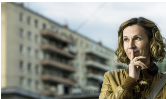
Abbildung 10 Die Migrantigen