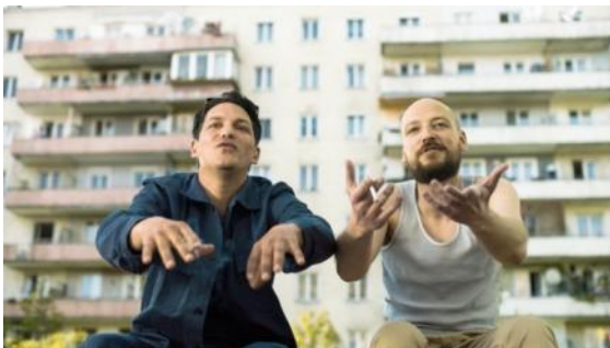
Abbildung 9 Die Migrantigen