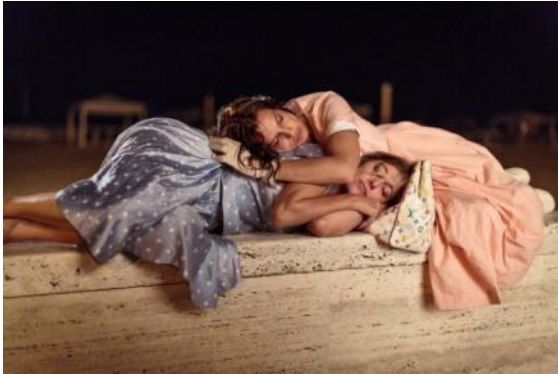
Abbildung 7 Die Überglücklichen